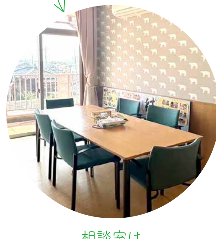
相談室は しろくまの壁紙