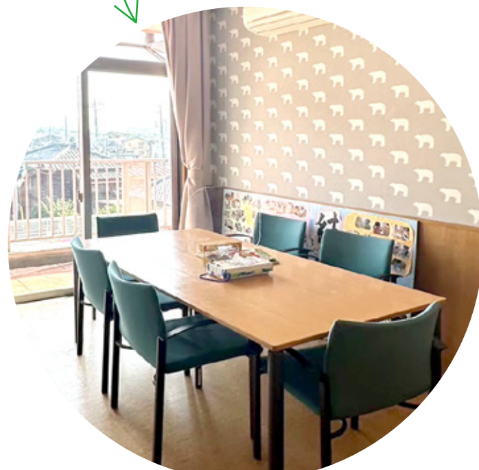
相談室は しろくまの壁紙