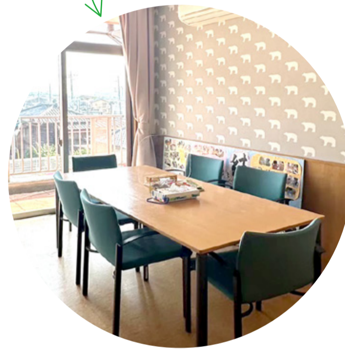
相談室は しろくまの壁紙