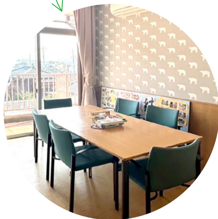
相談室は しろくまの壁紙